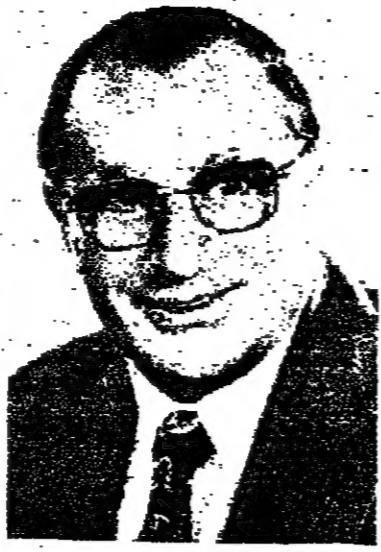
السيد آريه غورئيل رئيس بلدية حيفا

في هذا اللقاء الخاص (اللاناء) سرنا ان نسبح من رئيس بلدية حيفا الكثير من الاشياء الكثيرة التي تخص المواطن العربي في مدينة حيفا كذلك تشمل القرى الدرزية الواقعة قريبا من حيفا وهي دالية الكرمل وعسفيا وكذلك قرى الكباريه وهناك بادرة حسنة جدا ونوايا طيبة للتطوير في الاحياء العربية التي سيخصص لها الميزانيات والتي سيمولها رئيس بلدية حيفا على العمل في تنفيذ بعض المشاريع والمخصصات الهامة التي تعالج الازواح العربية في المدينة .. ومن هذا المنطلق كان سؤالي الاول ..